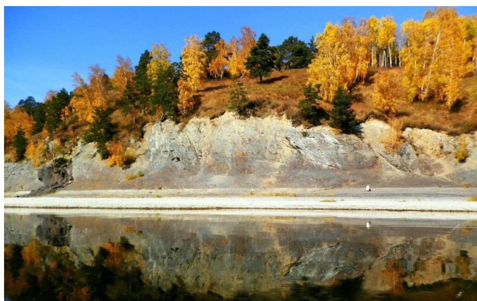
Природный геологический памятник "Синий Утес" - Томская область