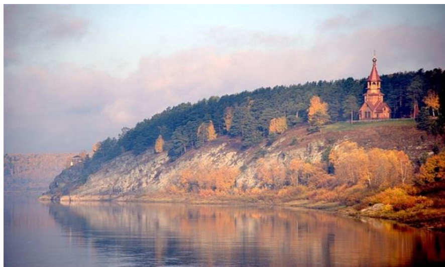
Заповедник «Томская писаница»(р.Томь Кемеровская обл)