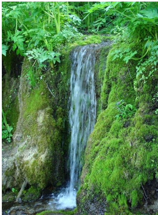
Памятник природы Родник «Дызвездный ключ» (Ларинский заказник) с. Батурино