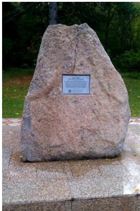
Камень-символ геофизического центра Евразии