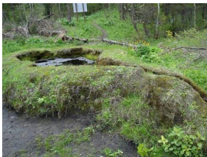
Памятник природы «Таловские Чаши» (поселок Басандайка)